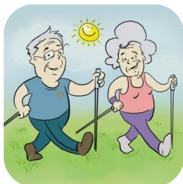
Wycieczki piesze z kijkami Nordic Walking