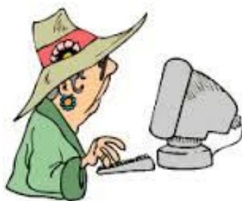
Zajęcia z podstaw obsługi komputera