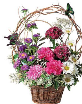
Warsztaty rękodzieła artystycznego